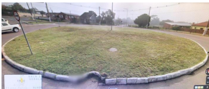
Avenida São Geraldo (Ermo)