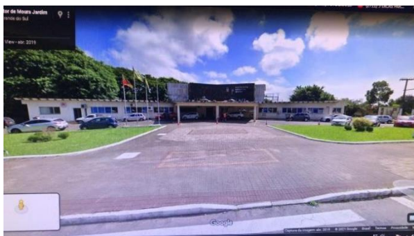
Avenida Nestor de Moura Jardim Centro (rótula da prefeitura municipal de Guaíba)