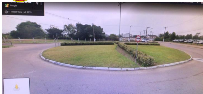
Praça Gastão Leão (Centro)

ESTE DOCUMENTO FOI ASSINADO EM: 09/06/2022 16:22 -03:00 -03 PARA CONFERÊNCIA DO SEU CONTEÚDO ACESSE https://c.atende.net/p62a248660029d .